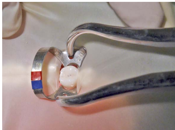
図 3 クランプ装着

講義前のクランプ装着時のVAS値は平均値14.35、中央値9で、除去時のVAS値は12.11、中央値5であった。講義後のクランプ装着時のVAS値は平均値